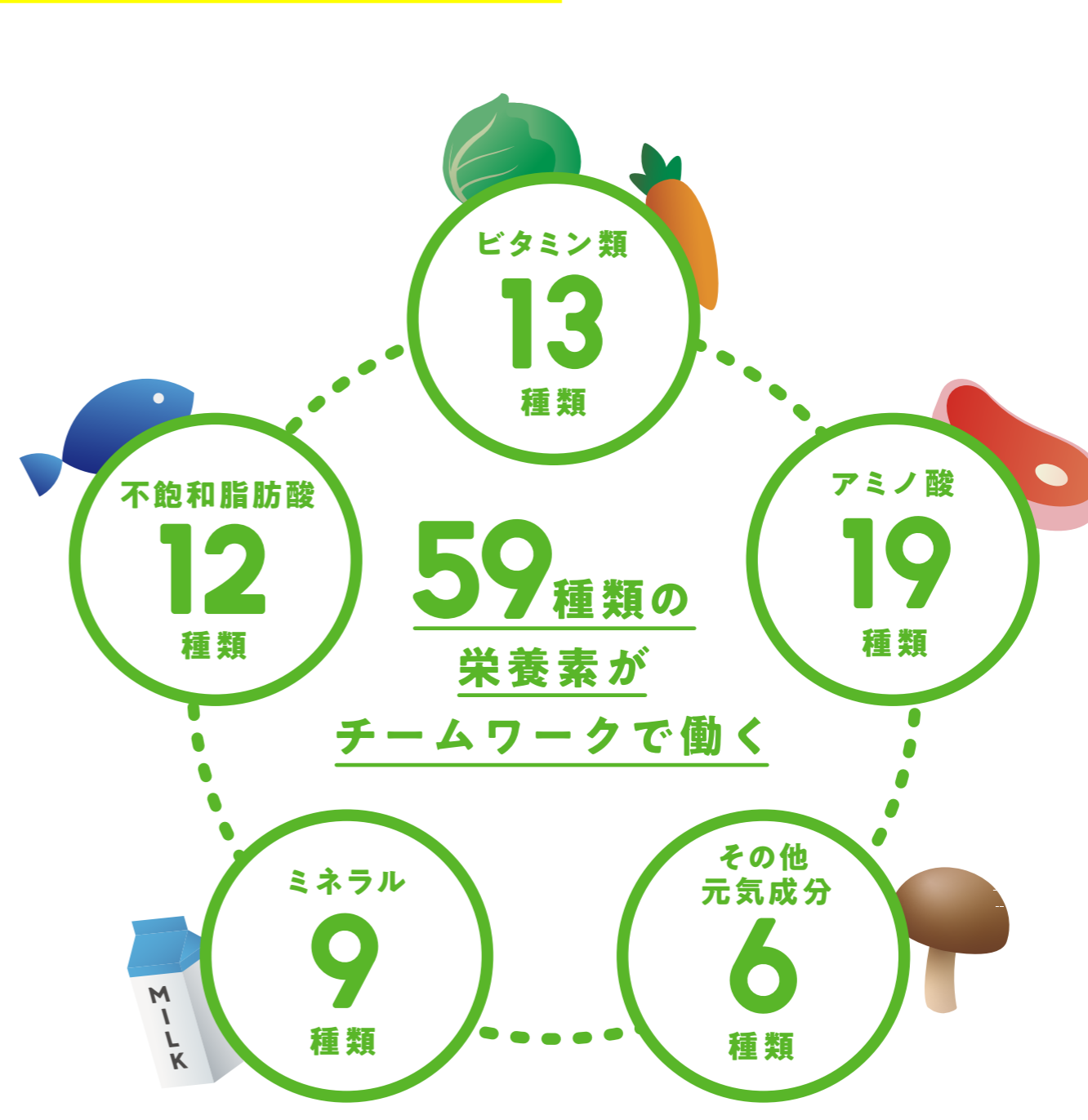
※石垣島ユーグレナに含まれる栄養素